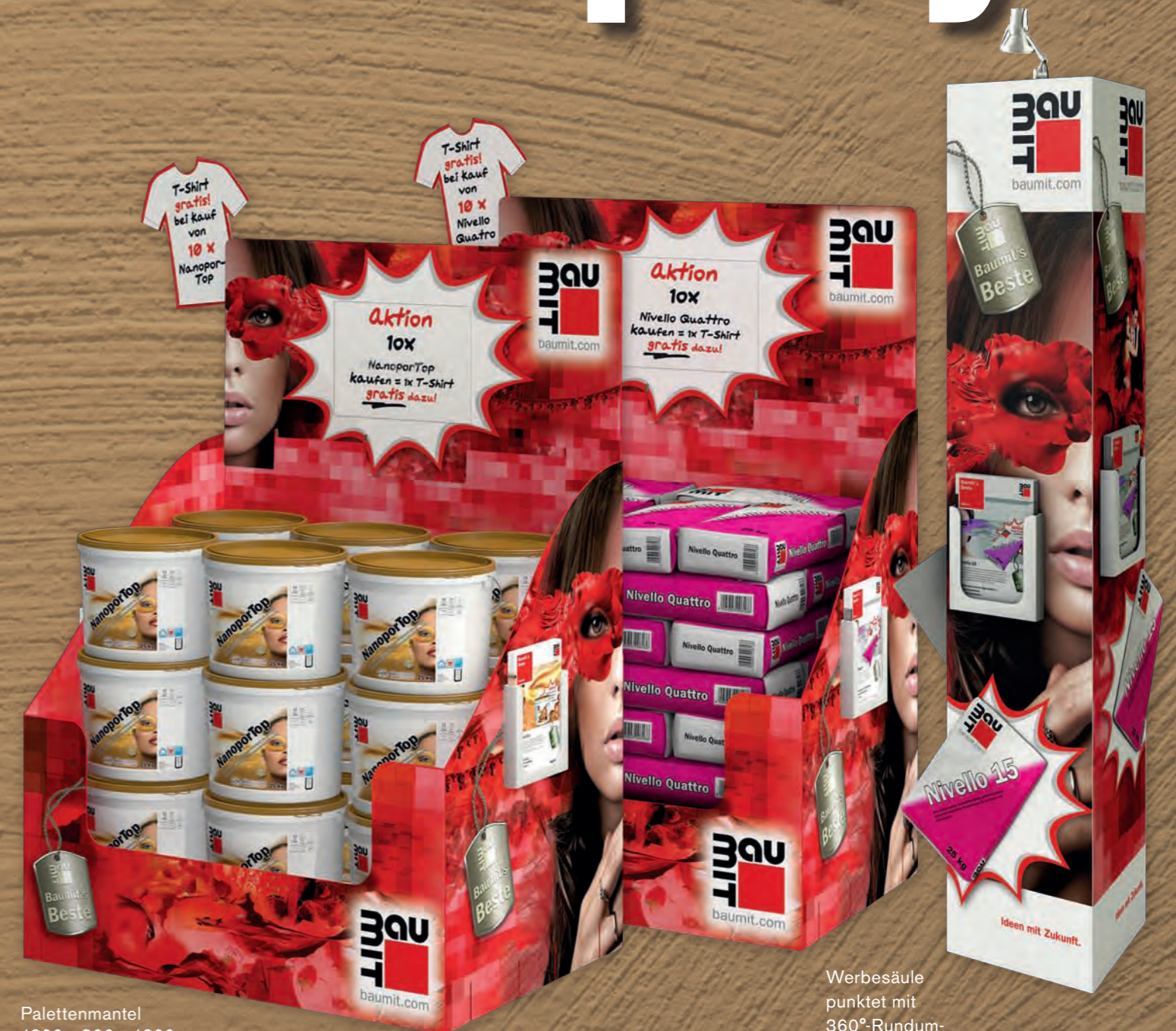
Palettenmantel 1200 x 800 x 1200 mm