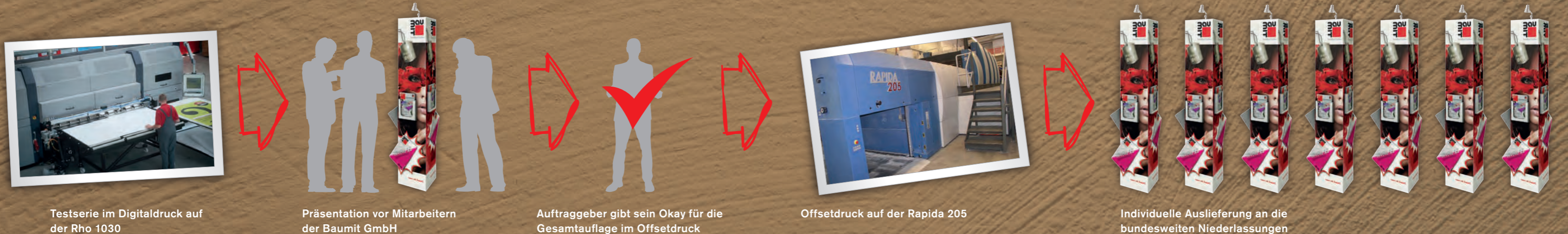
Testserie im Digitaldruck auf der Rho 1030