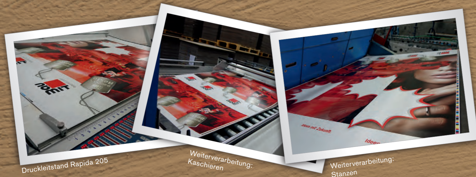
Druckleitstand Rapida 205

Nun übernahm unser auflagenstarker Offsetdruck die Arbeit. Routiniert bekamen die Druckbögen Farbe. Kaschiert, gestanzt und konfektioniert wanderten die fertigen Werbeträger dann in die handlichen Packerheiten. Diese mussten besondere Ansprüche erfüllen. Einerseits sollten die Mitarbeiter die Werbeträger inklusive Zubehör sicher transportieren können und andererseits musste die Verpackung noch in einen PKW passen.